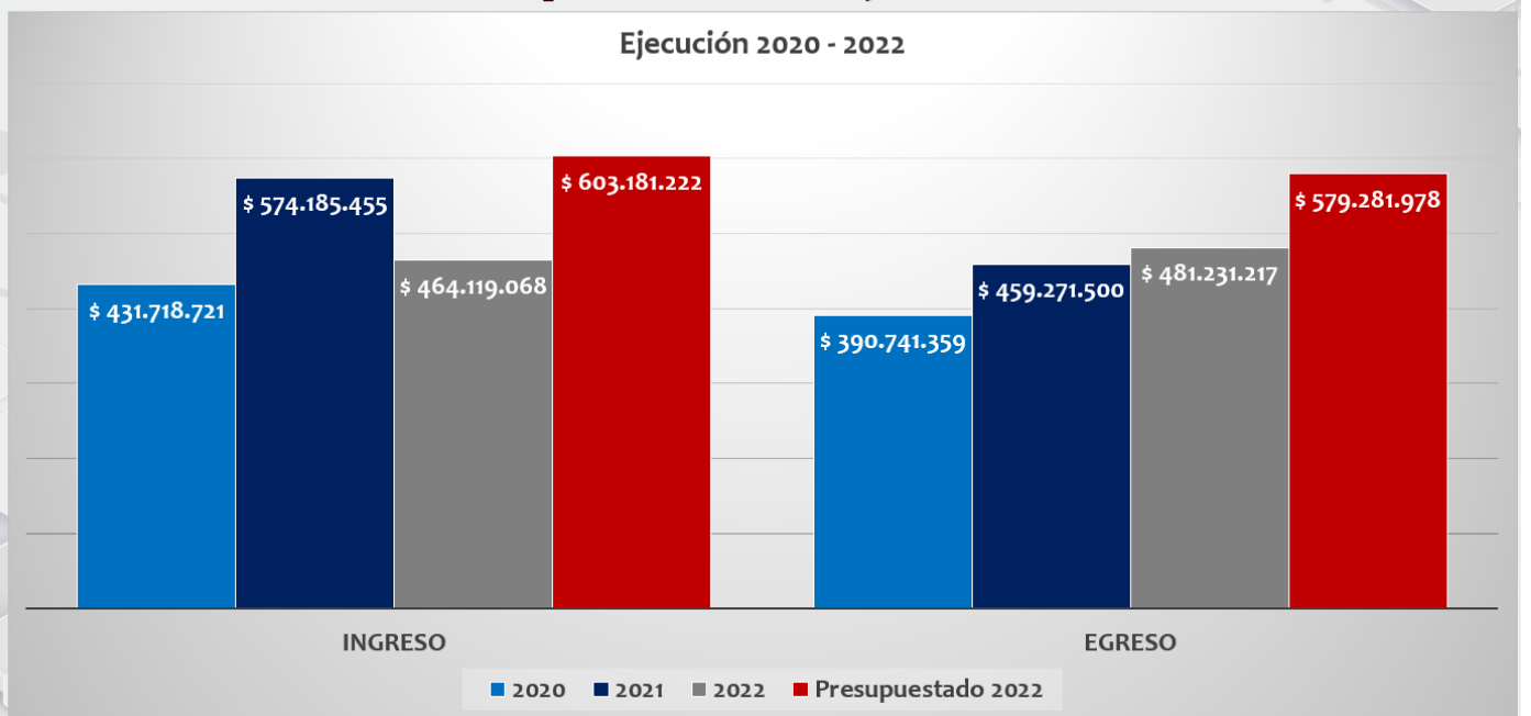
Ejecución 2020 - 2022